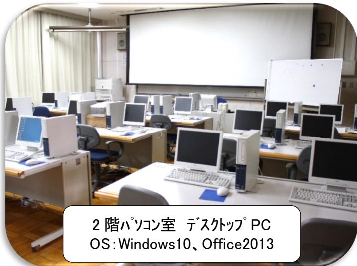
2階パソコン室 デスクトップ PC OS: Windows10、Office2013